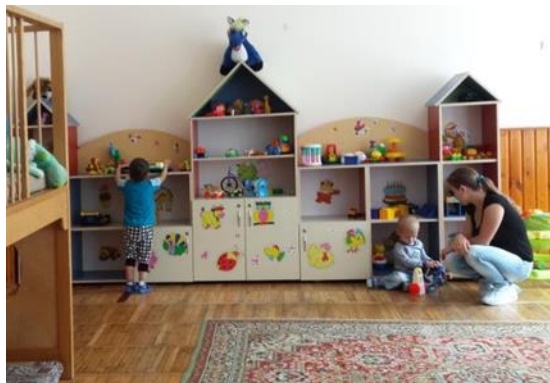
Montessori, logopedia, massaggi e tutto gratuito

Il primo e più bel progetto che visitiamo è un centro di riabilitazione a misura di bambino e che stranamente assomiglia al nostro hotel. Una specie di favola in rilievo. Dipinto in modo colorato, casalingo, attivo, con molte terapie e pazienti. In una piccola stanza, genitori e bambini con problemi respiratori stanno guardando un video. Montessori, logopedia, bagni e massaggi, elettrostimolazione, fototerapia, hanno tutto e vorrebbero da noi materiale ancora più innovativo. Non trattano la spina bifida o l'idrocefalia. I genitori che vivono troppo lontano possono pernottare con i loro figli. E tutto questo è gratuito per il paziente. Il direttore medico lavora qui da 20 anni e ha costruito tutto questo. I bambini di età compresa tra 0 e 7 anni sono i benvenuti qui, ma vogliono, se paghiamo questo, estenderlo ai bambini più grandi e ad altri destinatari.