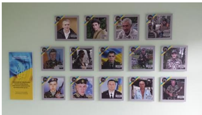
I caduti Ucraini

Il primo e più bel progetto che visitiamo è un centro di riabilitazione a misura di bambino e che stranamente assomiglia al nostro hotel. Una specie di favola in rilievo. Dipinto in modo colorato, casalingo, attivo, con molte terapie e pazienti. In una piccola stanza, genitori e bambini con problemi respiratori stanno guardando un video. Montessori, logopedia, bagni e massaggi, elettrostimolazione, fototerapia, hanno tutto e vorrebbero da noi materiale ancora più innovativo. Non trattano la spina bifida o l'idrocefalia. I genitori che vivono troppo lontano possono pernottare con i loro figli. E tutto questo è gratuito per il paziente. Il direttore medico lavora qui da 20 anni e ha costruito tutto questo. I bambini di età compresa tra 0 e 7 anni sono i benvenuti qui, ma vogliono, se paghiamo questo, estenderlo ai bambini più grandi e ad altri destinatari.