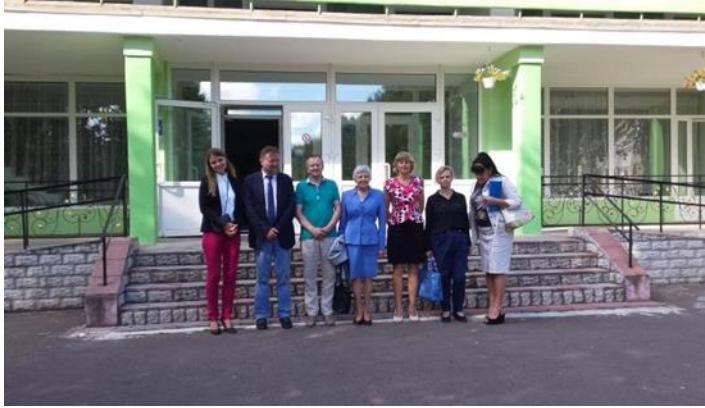
La nostra delegazione posa di fronte ad un edificio