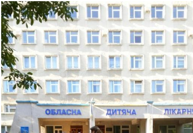
Rivne, una città desolata con architettura piatta