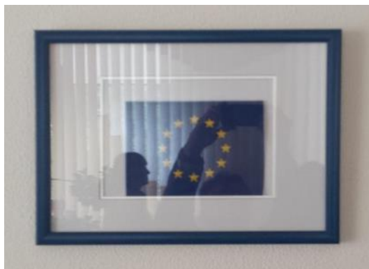
La bandiera dell'Europa incorniciata

Visitiamo prima i responsabili del comune di Rivne e poi quelli della provincia. Nei corridoi di queste amministrazioni sono appese, in un disegno da eroe comunista, le vittime delle proteste di Euro-Maidam. Il governo ucraino non ha ancora trovato un'altra lingua per i suoi eroi. Il comunismo ha effettivamente distrutto l'intera cultura originaria. Dopo la seconda guerra mondiale deportarono intellettuali in Siberia, bruciarono libri e riscrissero la storia. Chi ha 70 anni ora non ha mai conosciuto altro che il comunismo e poi la guerra. Nell'ufficio del responsabile della provincia, il logo della bandiera europea è stato incorniciato come un'opera d'arte ma l'immagine è purtroppo caduta fuori dalla sua cornice.